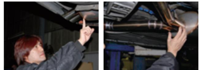
太鼓は平面板の「巻き締め」でなく金型プレス曲面板の溶接仕上げ。手間とコストは掛かるが不快なビビリ音を無くす。集合部の角度は30度で等面積で集合しなくてはならない。圧力波の一次反射を利用するには長さや角度、さらに仕上げも重要。

エンジンの爆発サイクルから計算する一次振動 4サイクルエンジンは、クランク2回転で1回爆発するので、8気筒の場合だとクランク2回転で8回爆発する。つまり、1000rpmだと下記のようになる。 f [Hz] = 4 \times n [rpm] / 60 = 66.6Hz 例えば、3000rpmだと200Hzの脈動が生じる。脈動には波があるから、この反射波を利用して、負圧を発生させるというのが脈動利用の仕組み「表2」の干渉と同じ理屈である)だ。