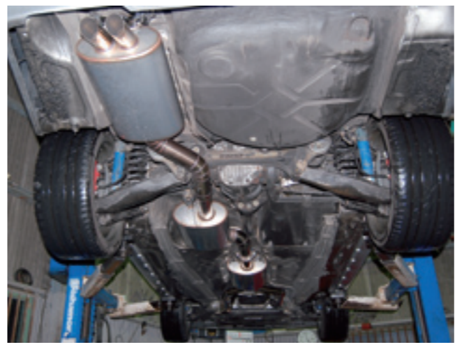
6リッターAMGカムにJMOトルコンだとこの長さという全景図。フルストレート構造で消音するには、排気量の3倍の太鼓容量が必要。さらなる進化は……をうご期待!