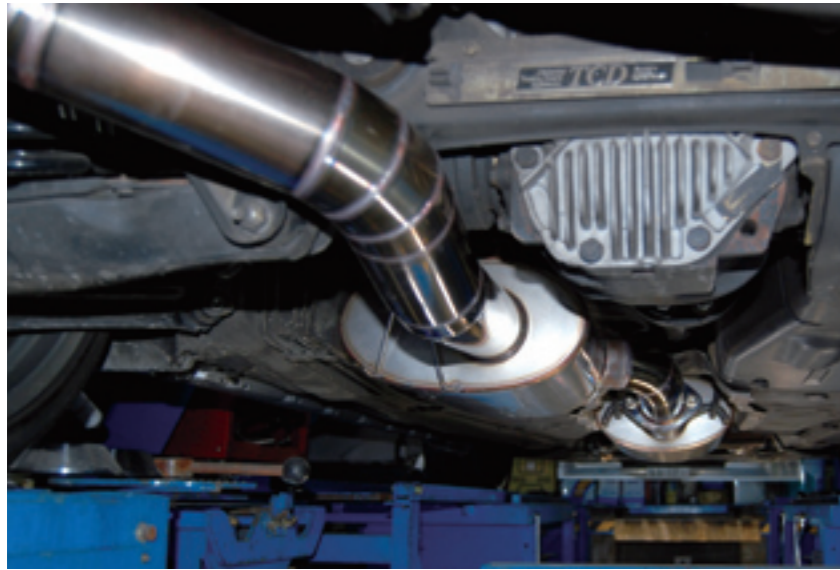
排気温度や圧力はターブルにいくに従って下がるからメガン形状に広げていくのが理想。場当たり的なワンオフではなく流体力学と音響理論に従った仕様だ。

文・撮影=500E 倶楽部制作委員会 写真=古閑章郎 (GERMANCARS 写真部) 協力=ガレーズちごや/エスファクトリー/SPEEDJAPAN