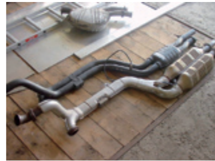
Fパイプはφ55。JIS規格にはないの で3軸ローラーで薄肉板を巻いて作った 「手巻」の輪切り、伊勢エビ仕様。 純正はAT前で集合し再分岐、触媒レスは中 間太鼓までツアル。いずれもR129やW 210と比べると妥協が見える。